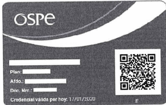
Imagen de credencial digital:

La Credencial Digital OSPE cuenta con los siguientes datos: